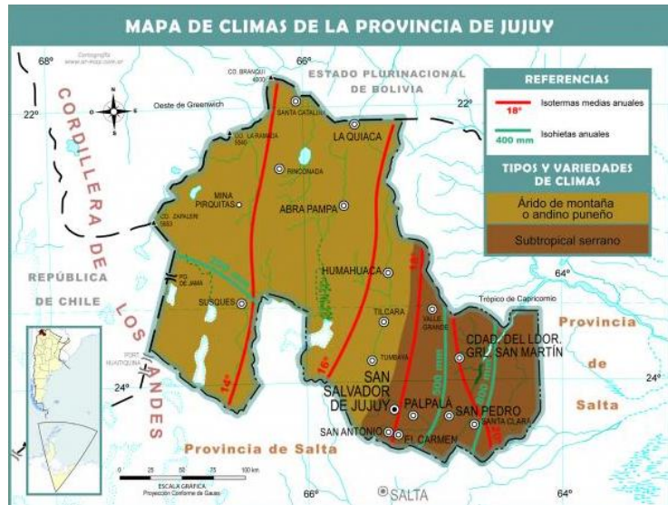
Mapa Físico - Mapoteca Argentina del Portal Educativo Educ.ar

El clima de la Puna Jujeña identifica a esta región con el Sur de nuestro país, pero también la escasa población asentada en la misma es un elemento que les es común. A ellas se suman las difíciles condiciones para el acercamiento de los alejados poblados con los centros que cuentan con la infraestructura necesaria para resolver los problemas esenciales vinculados con la salud, la justicia, el comercio, la educación y demás parámetros que tomando en cuenta el desarrollo con que cuentan otras zonas del país, demuestran la necesaria intervención en materia de políticas públicas del Estado Nacional.