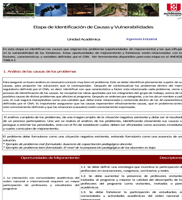
Figura 3. Ejemplo plan de mejoramiento

Posteriormente las directivas de la Universidad tomaron la decisión de someter el programa de Ingeniería Industrial a la evaluación externa o evaluación por pares para la verificación de las condiciones internas del programa académico.