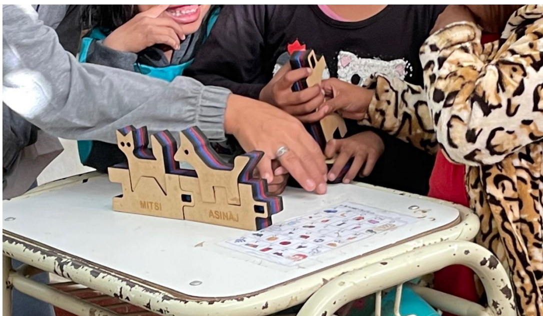
Figura 3. Niños jugando con el prototipo del pasante.